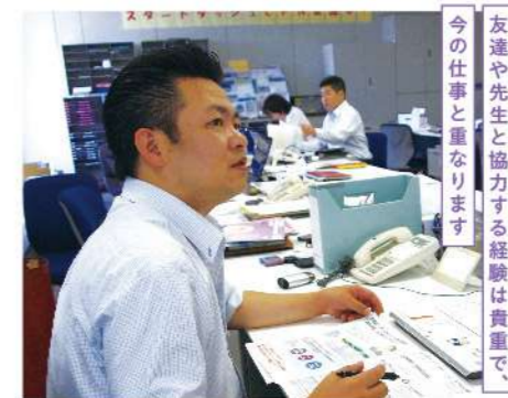
友達や先生と協力する経験は貴重で、今の仕事と重なります。

在学中にしっかり社会のルールやビジネスマナー、コミュニケーション能力を身につけ、社会に必要な技術や実践力を養い就職に備えます。