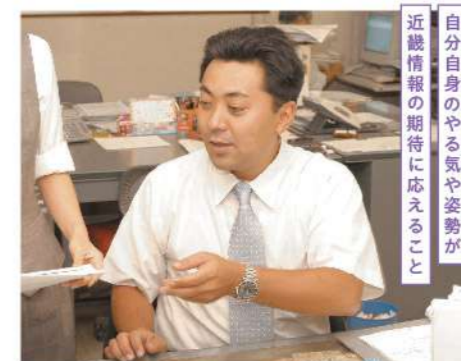
自分自身のやる気や姿勢が近畿情報の期待に応えること