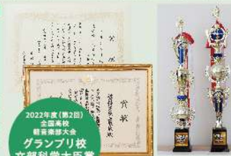
2022年度(第2回) 全国高校 音楽コンクール 文部科学大臣賞 P.23へGO!

●総合的な探究の時間は、年間を通じて2単位に相当する時間数をあてます。 ●上記教育課程は、変更する場合があります。